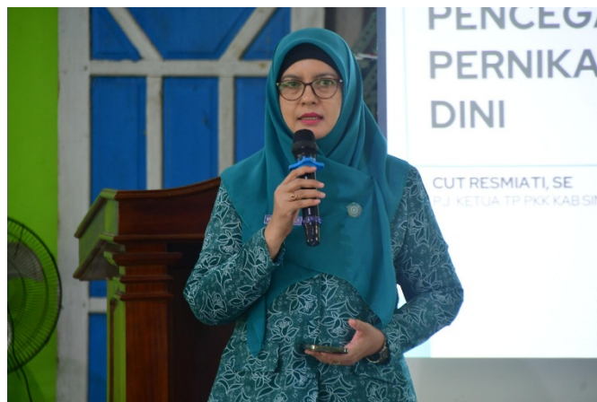
Gambar 5. Penyampaian Materi