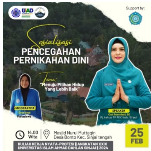
Gambar 2. Spanduk Sosialisasi Pencegahan Pernikahan Dini

dilakukan yakni melakukan suatu perbincangan dengan ibu-ibu desa Bonto dan masyarakat setempat.