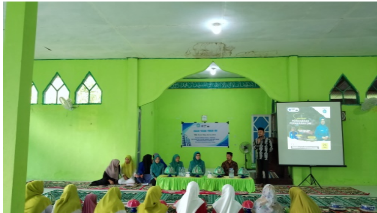
Gambar 3. Pembukaan oleh Bapak Camat Sinjai Tengah

satu orang, dan tentu saja mereka mempunyai pengetahuan yang baik tentang penundaan pernikahan di usia muda. Pencegahan pernikahan dini Variabel-variabel yang menyebabkan pernikahan dini dibahas pada pokok bahasan pertama. Faktor utama yang menyebabkan pernikahan remaja adalah kebutuhan untuk memulai sebuah keluarga saat ini dan ketidaktahuan akan kekurangan anak, anak-anak, dan diri mereka sendiri. Mematuhi adat istiadat dengan ketat merupakan komponen penting lainnya.