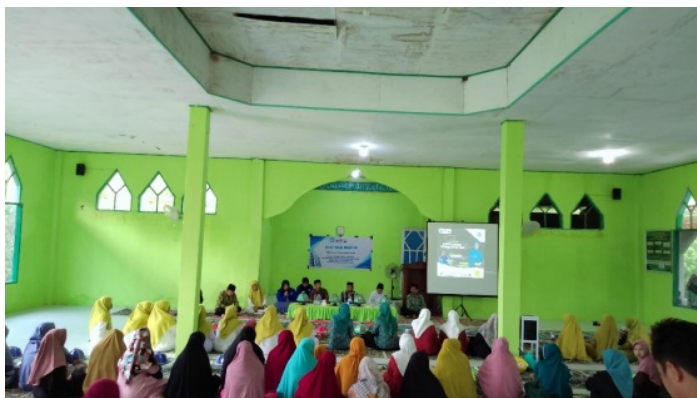
Gambar 6. Peserta Sosialisasi Mengajukan Pertanyaan kepada Pemateri

Pemateri menawarkan pemantauan masyarakat dan ide-ide untuk menghentikan pernikahan dini pada tahap refleksi berikutnya. Hal ini sesuai dengan temuan pada kegiatan sosialisasi, dimana peserta kembali menunjukkan semangat yang tinggi. Partisipasi masyarakat dalam sesi tanya jawab dan kegiatan sosialisasi dari awal hingga akhir menunjukkan hal tersebut.