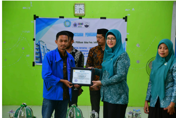
Gambar 7. Pemberian Piagam Penghargaan

Koordinator desa KKN-P secara pribadi menyerahkan piagam penghargaan sebagai tanda berakhirnya acara sosialisasi, yang dilanjutkan dengan rangkaian pemaparan materi yang telah disampaikan oleh narasumber dan seluruh pertanyaan dari masyarakat termasuk dari para pemimpin muda perempuan.