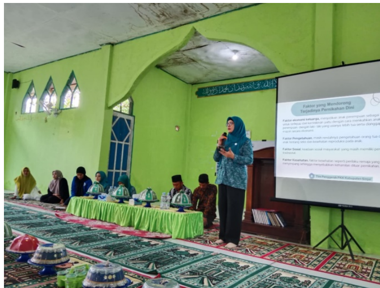
Gambar 4. Penyampaian Materi oleh Pj. Ketua TP-PKK Kab. Sinjai

Akan tetapi tujuan demikian hanya menyusahakan dikarenakan akan banyaknya perbedaan pendapat pada lingkungan masyarakat Islam mengenai kebenaran kisah Nabi SAW dan 'Aisyah r.a. menikah saat dibawah umur. Demikian dari pada itu, sangat jelas terlihat dari suatu peraturan yang dibentuk dalam perundang-undangan pemerintah di Indonesia yang diberlakukan hingga sekarang ini bahwa menikahkan seorang putra maupun putri yang berada dibawah 18 tahun merupakan suatu tindakan yang tidak diperbolehkan. Oleh sebab itu, maka tidak boleh lagi pembenaran dalam seseorang manapun agar melegitimasi praktiknya dalam hal pernikahan seorang di bawah umur.