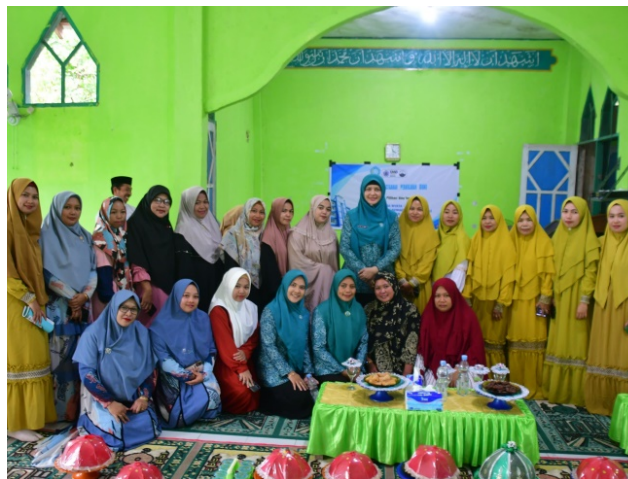
Gambar 8. Foto Bersama Kegiatan Sosialisasi Pencegahan Pernikahan Dini

Koordinator desa KKN-P secara pribadi menyerahkan piagam penghargaan sebagai tanda berakhirnya acara sosialisasi, yang dilanjutkan dengan rangkaian pemaparan materi yang telah disampaikan oleh narasumber dan seluruh pertanyaan dari masyarakat termasuk dari para pemimpin muda perempuan.