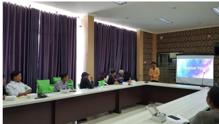
Gambar 2. Pemaparan Materi

Setelah para peserta kegiatan mengisi daftar hadir dan pre-test , kemudian peneliti melakukan sosialisasi yang diawali dengan sambutan dari pendamping lapangan dan dilanjutkan dengan pemaparan materi tentang pamflet dan aplikasi canva. Pemaparan materi berlangsung sekitar 40 menit.