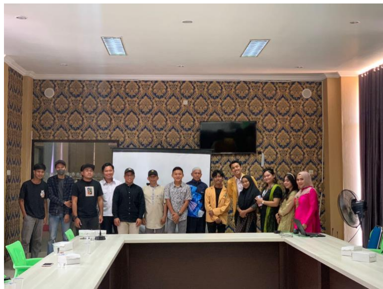
Gambar 4. Penutup/Dokumentasi

Setelah pemaparan materi selesai, peneliti memberikan post-test yang akan diisi oleh peserta kegiatan. Hal ini bertujuan untuk mengukur tingkat keberhasilan dari kegiatan ini. Pengisian pre-test dan post-test ini bertujuan agar dapat membantu peneliti mengukur seberapa baik materi yang telah disampaikan dan apakah peserta pelatihan dapat memahami materi dengan baik setelah sosialisasi berlangsung. Setelah pengisian post-test selesai, kemudian peneliti memberikan pelatihan kepada peserta kegiatan serta membuka sesi diskusi dan kemudian kegiatan ini ditutup dengan sesi dokumentasi bersama sebagian peserta yang masih hadir sampai kegiatan selesai.